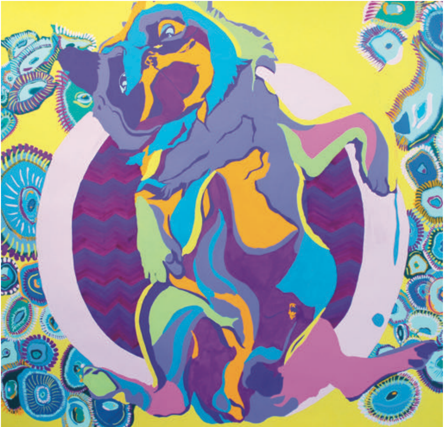
Carlin , 2016 Gouache sur papier, 50*50