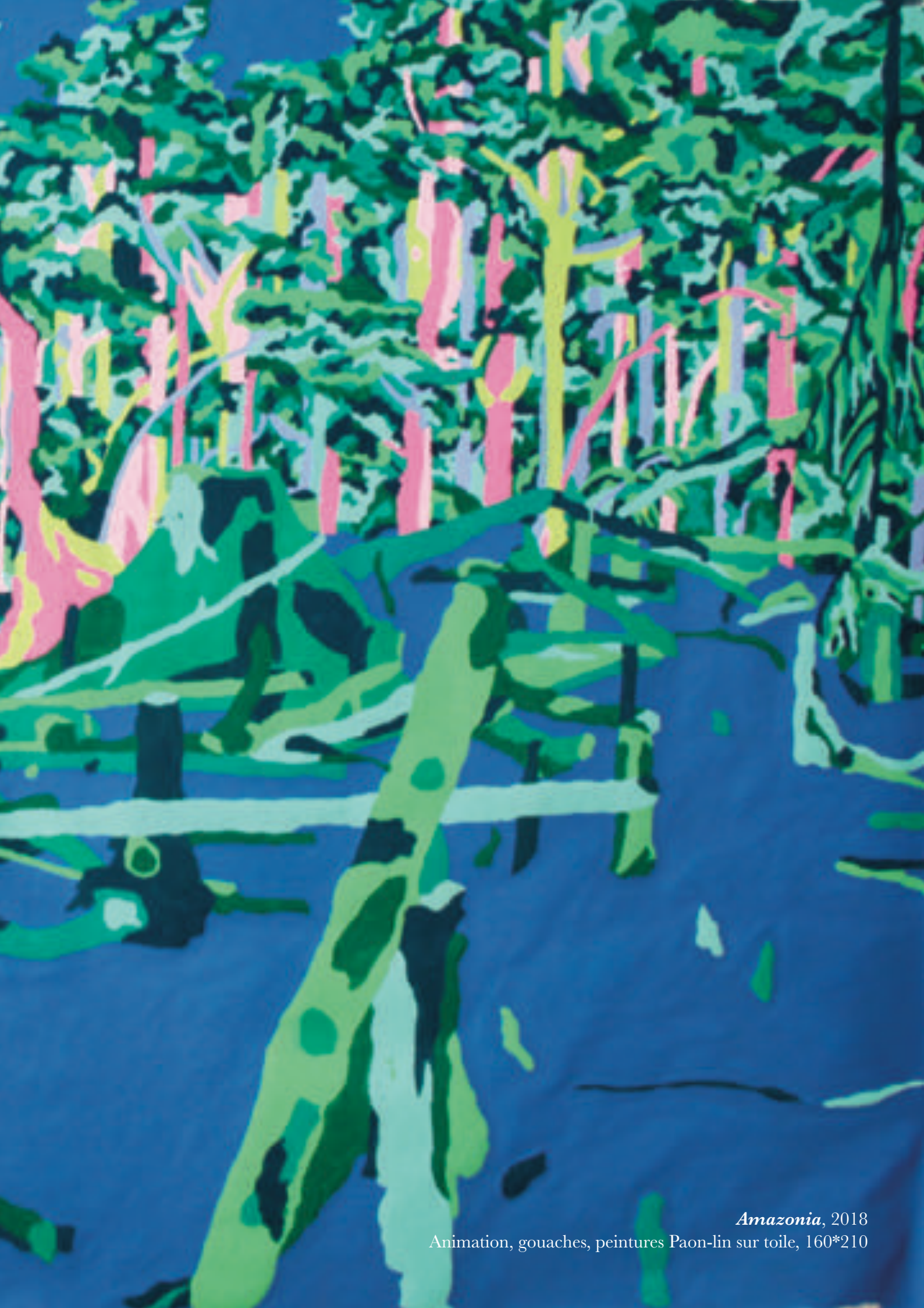
Amazonia , 2018 Animation, gouaches, peintures Paon-lin sur toile, 160*210