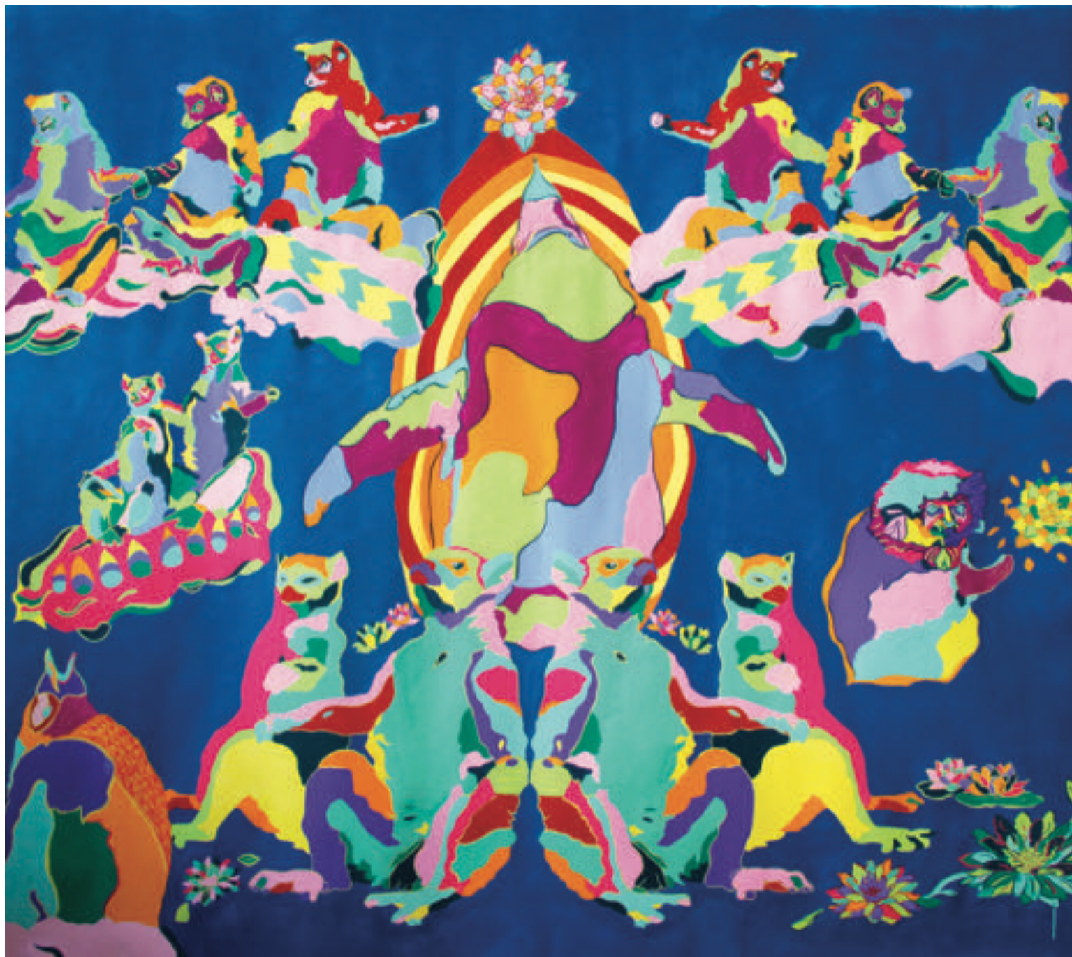
Transfiguration animale , 2018 Goaches, peintures Paon-lin sur toile, 180*190