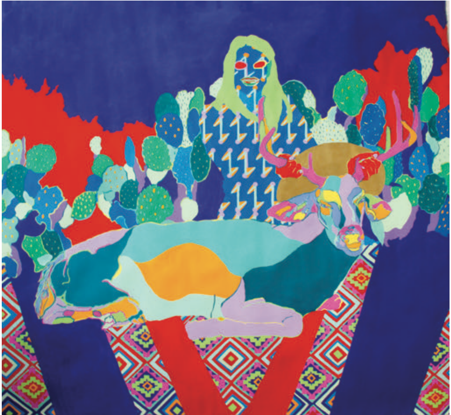
La mort du cerf sacré : Au plaisir de Kendall Jones, 2017 Goaches, peintures Paon-lin sur toile, 200*210